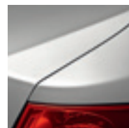
GRIS PLATINE (TE)