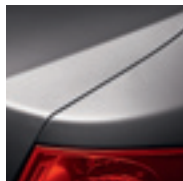
GRIS CASSIOPÉE (TE)