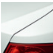
BLANC GLACIER (OV)