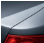
BLEU ÉCUME (TE)