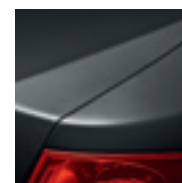
GRIS ECLIPSE (TE)