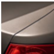
BEIGE POIVRÉ (TE)